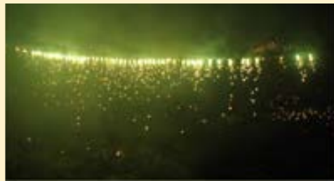
花火は毎年 ご好評を頂いて おります。 ありがとうございます！