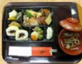
敬老祝賀会開催日のお祝い膳です。