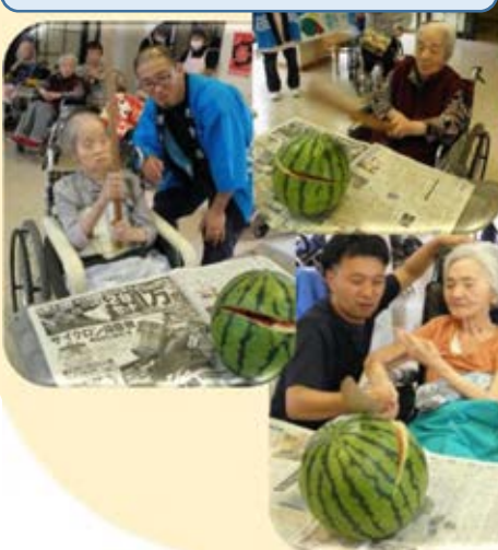
皆さんの力でスイカを割ることができました！