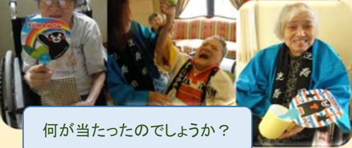
何が当たったのでしょうか？