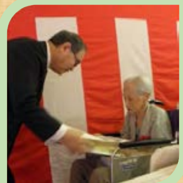
柴戸様(101歳) ご自分で車椅子を操作しておられます。