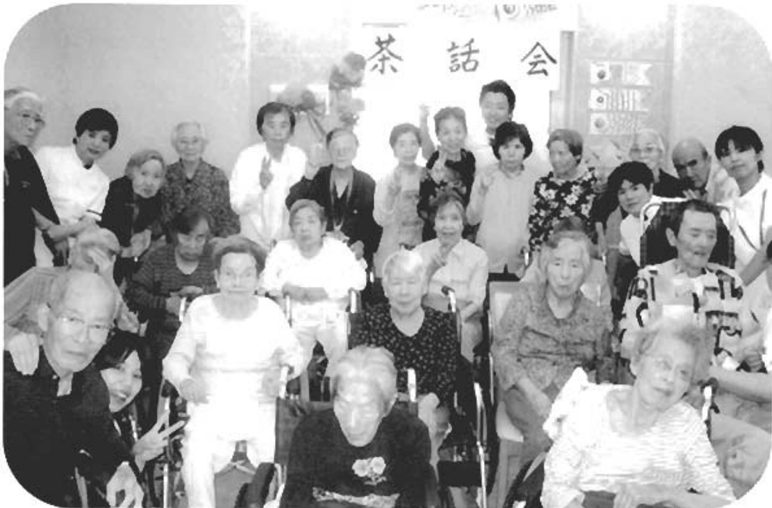
3階 5月29日茶話会にて