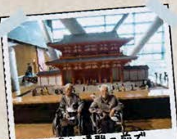
大きな模型の前で ハイポーズ!!