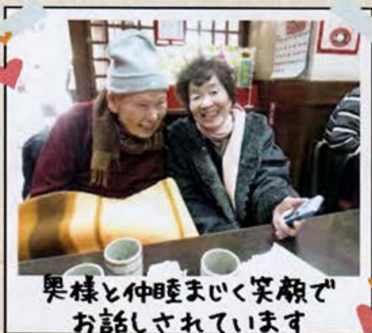
奥様と仲睦まじく笑顔で お話しされています