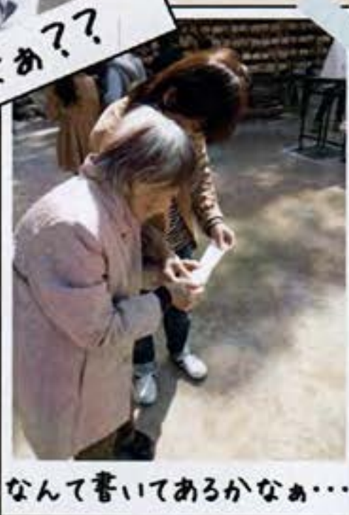
なんて書いてあるかなあ...