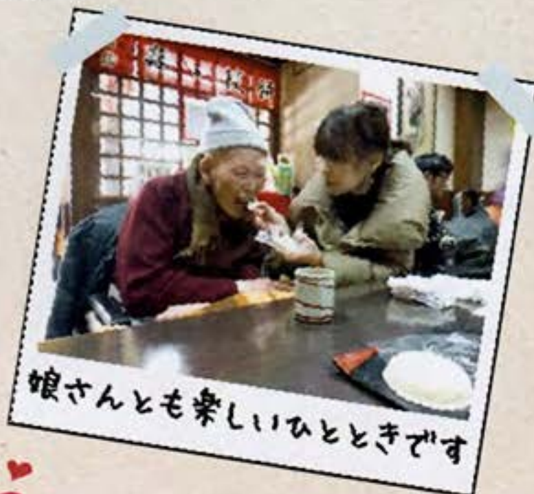
娘さんとも楽しいひとときです