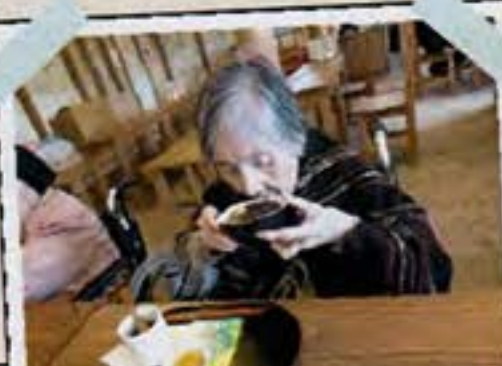
ぜんざいを食べたくて しかたなかったそうです!