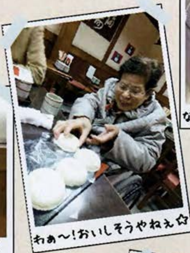
わあ~!おいしそうやねえ☆