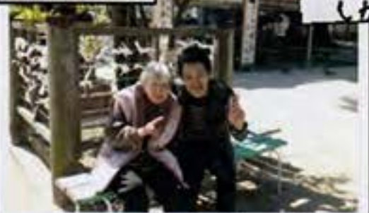
2人で仲良く記念写真☆