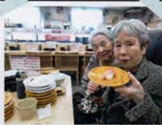
2人で9皿目?! まだまだ入るわよ〜