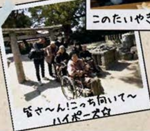
皆々〜ん!ニっち向いて〜 ハイポーズ☆