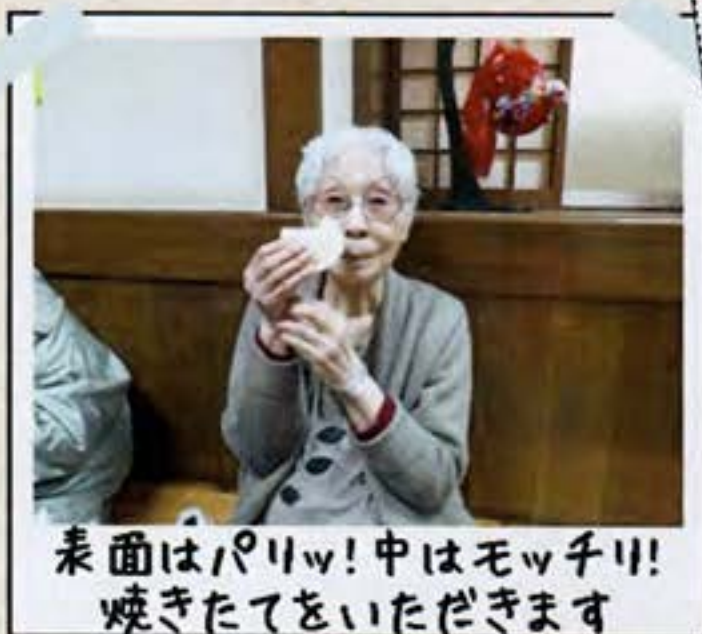
表面はパリッ!中はモッ千リ! 焼きたてをいただきます