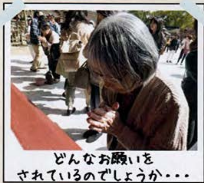
どんなお願いを されているのでしょうか...

◇ この日は少し肌寒く、風も強い日でしたが、本殿でお参りし、おみくじを引かれました。おやつには梅ヶ枝餅を食べられ、皆さん寒さを忘れて楽しんでいました。 また、ご家族も参加され、奥様や娘さんと一緒に楽しいひと時を過ごされました。