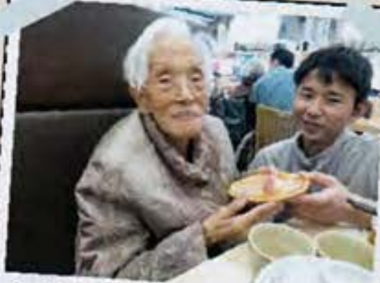
あなたもおひとついかが？

九州国立博物館では、他国と日本の文化交流の歴史や貴重な文化財などを観覧することができ、 「すごいねえ〜」「きれいやねえ〜」と感心され、しばし見入っておられました。