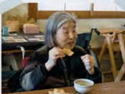
このたいやき最高だわ!!