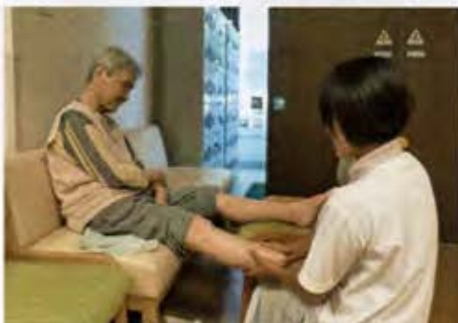
☆オイルマッサージ☆