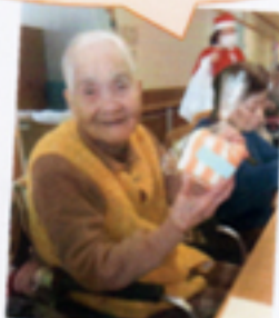
開けるのが楽しみ