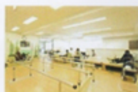
リハビリテーション室